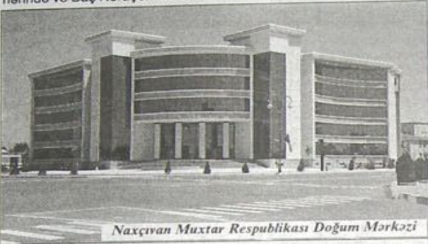
Naxçıvan Muxtar Respublikası Doğum Mərkəzi

de malyariya əleyhinə stansiyalar yaradıldı.