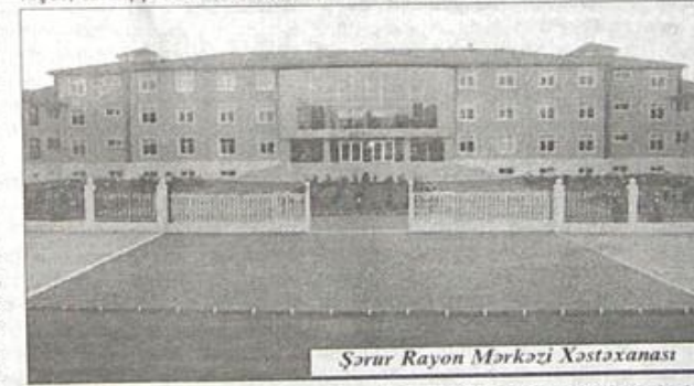
Şərur Rayon Mərkəzi Xəstəxanası

Əlbəttə, hər kəs etiraf edər ki, Naxçıvanda səhiyyə sistemində, muxtar respublika əhalisinin sağlamlığına göstərilən qayğı da heç vaxt indiki qədər olmayıb. Regionumuzda 1996-cı ildən başlayan dönüş mərhələsi, inkişaf, tərəqqi bütün sahələr kimi