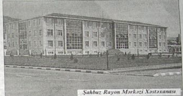
Şahbuz Rayon Mərkəzi Xəstəxanası

kənd, Babək rayon Sirab, Culfa rayon Ərəzin kənd ambulatoriyaları, Şərur rayon Daşqar, Sədərək rayon Qaraağac kənd FMM-ləri tikilərək, müasir avadanlıqlarla təchiz edilərək istifadəyə verilməsi, 2009-cu ilin "Uşaq ili" elan edilməsi ilə əlaqədar Naxçıvan şəhər Kərpələr Evi-anadangalma qüsurlu uşaqlar ailələrə kömək məqsədilə Kərpələr Evi və Ailələrə Dəstək Mərkəzinə çevrilmişdir. Bu işlər bu gün də davam etdirilir. Bu il daha bir neçə xəstəxana, həkim ambulatoriyaları tikilərək istifadəyə veriləcək. Sədərək RMX-nin isə tikintisi başa çatdırılıb, binanın istifadəyə verilməsi üçün son tamamlama işləri